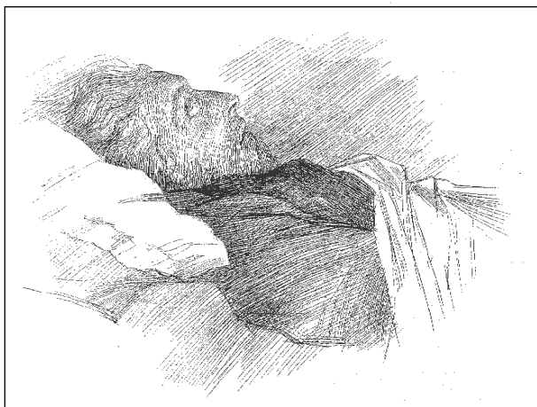
Adam Mickiewicz na łożu śmierci

Historycy wszelkiego autoramentu, a szczególnie literaturoznawcy, często bardziej sobie wyobrażają przeszłość na podstawie niepełnych przesłanek dokumentalnych, a nie odtwarzają owe dzieje tak, jak się działy w oczach ówczesnych